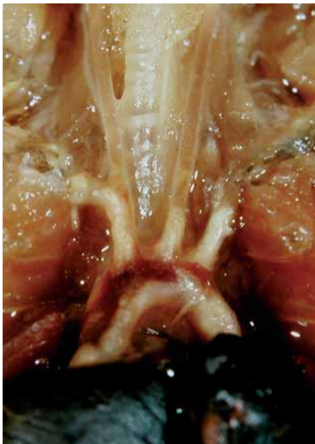
Aterosklerose hos en 1 år gammel ApoE -/- -mus.

eller i koagulationssystemet er ukendt. En mulighed er, at grisen kun i begrænset omfang benytter sig af det eksterne koagulationssystem (3) . I hvert fald er blodets protein-koncentrationer af de interne koagulationsfaktorer langt højere end i mennesket (se tabel 1), og samtidigt er faktor VII-aktiviteten (FVIIa) tilsyneladende meget lav, når man måler med humane analysemetoder. Forskelle i koagulationssystemet kan